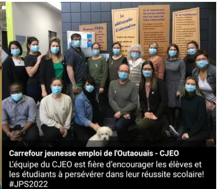
Les Carrefours jeunesse-emploi ont souligné les JPS de diverses façons (L'équipe du CJE de Pontiac à gauche et du CJEO à droite)