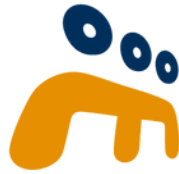
TABLE ÉDUCATION OUTAOUAIS

LES JOURNÉES DE LA PERSEVÉRANCE SCOLAIRE